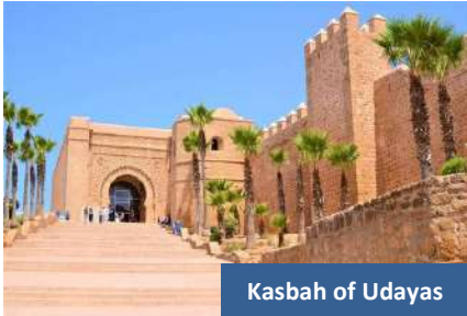
Kasbah of Udayas

Seterusnya, sambung perjalanan ke Casablanca , bandar terbesar di Maghribi yang terkenal dengan suasana moden dan bersejarah. Daftar masuk hotel dan bermalam di Casablanca.