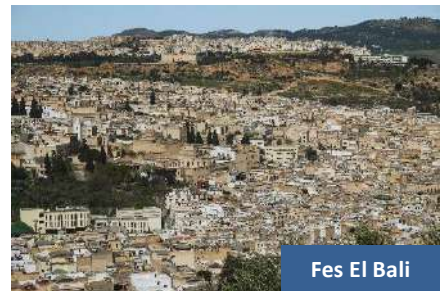
Fes El Bali