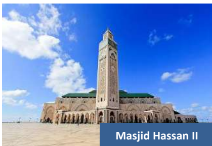
Masjid Hassan II

Disebelah petang, kembali ke hotel. Bermalam di Casablanca .