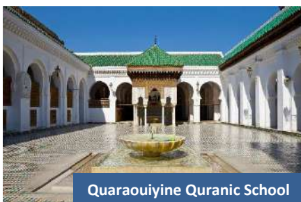
Quaraouiyne Quranic School

Pada sebelah petang, pulang ke hotel. Bermalam di Fes .