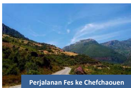
Perjalanan Fes ke Chefchaouen

Selepas sarapan pagi, perjalanan diteruskan selama 5 jam lagi ke bandar biru, Chefchaouen antara lokasi tarikan pelancong di negara ini. Kota indah ini terletak di Pergunungan Rif , di bahagian barat laut Maghribi. Dikenali sebagai kota yang memiliki bangunan tradisional sesuai untuk lokasi rakaman gambar dan video kerana bangunan berwarna biru yang indah dengan latar belakang Pergunungan Rif. Selepas daftar masuk hotel, peserta boleh menghabiskan masa meneroka dan membeli cenderahati di kota itu.