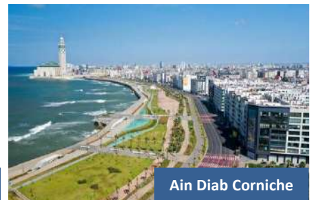
Ain Diab Corniche