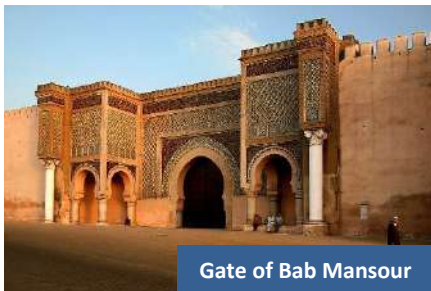
Gate of Bab Mansour

Bertolak ke Fes , kota yang dikenali sebagai ibu kota budaya bagi Maghribi. Ia terkenal dengan kota lama yang bertembok Fes El Bali dengan seni bina Marinid, pasar lama yang menjual pelbagai barangan serta cenderahati dan membawa kita ke zaman Hikayat Seribu Satu Malam. Bermalam di Fes .