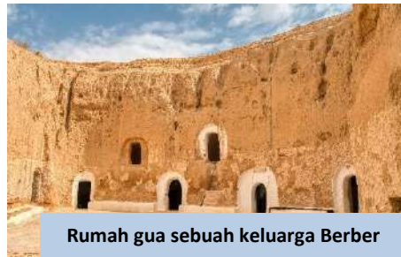
Rumah gua sebuah keluarga Berber