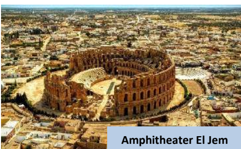
Amphitheater El Jem

Kemudian, meneruskan perjalanan ke Hammamet , destinasi peranginan pantai yang terkenal dengan suasana santai dan pemandangan Laut Mediterranean yang indah. Setibanya di sana, daftar masuk hotel dan nikmati makan malam buffet.