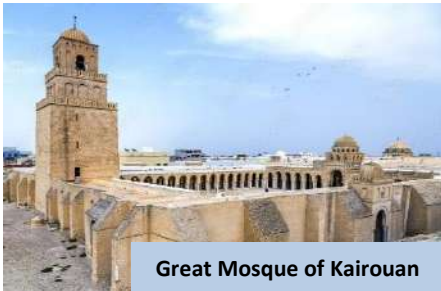
Great Mosque of Kairouan

Setibanya di sana, daftar masuk hotel dan berehat. Makan malam buffet disediakan di hotel dan bermalam di Tozeur .