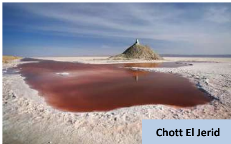
Chott El Jerid

Selesai lawatan, perjalanan diteruskan ke Sfax , bandar kedua terbesar di Tunisia yang terkenal dengan Medina bersejarahanya serta suasana tempatan yang masih mengekalkan tradisi Arab asli. Setibanya di sana, daftar masuk hotel dan nikmati makan malam buffet.