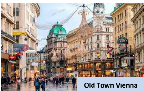
Old Town Vienna