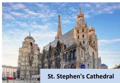
St. Stephen's Cathedral