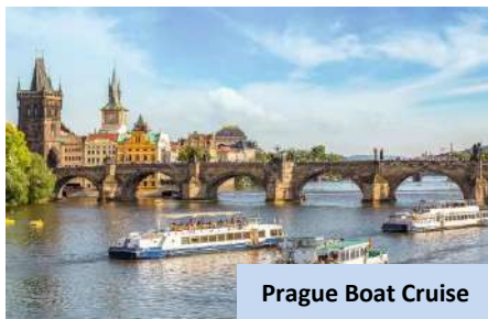
Prague Boat Cruise

Kemudian bertolak ke České Budějovice untuk bermalam.