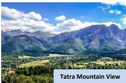
Tatra Mountain View

Kemudian, bertolak ke Krakow sambil menikmati pemandangan perkampungan serta banjaran Gunung Tatra yang indah. Tiba di Krakow , bersama local guide – nikmati lawatan di sekitar bandar Krakow merangkumi Market Square, Istana Diraja, Katedral dan 'Cloth Hall . Luangkan masa lapang anda di sekitar Bandar Lama Krakow . Akhir sekali, daftar masuk hotel. Bermalam di Krakow .