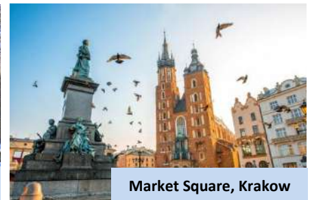
Market Square, Krakow