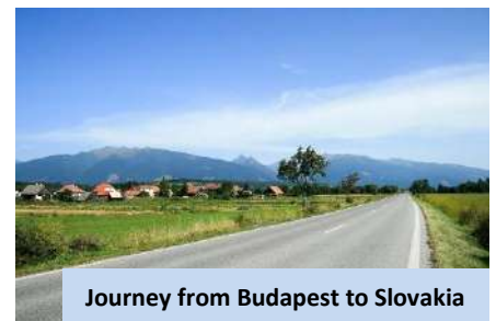
Journey from Budapest to Slovakia