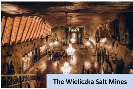
The Wieliczka Salt Mines