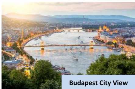
Budapest City View

Kemudian, teruskan perjalanan ke sebuah bandar di utara Slovakia di kaki Gunung Tatra, terkenal dengan landskap menarik untuk bermalam. Masa santai di kawasan hotel dengan menikmati permandangan Bajaran Tatra.