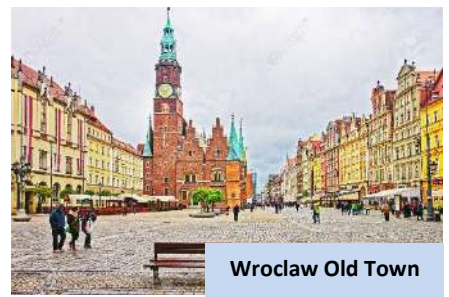
Wrocław Old Town