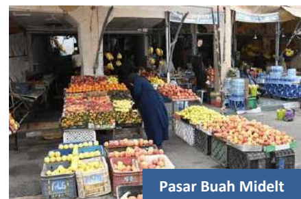
Pasar Buah Midelt