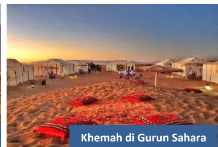
Khemah di Gurun Sahara