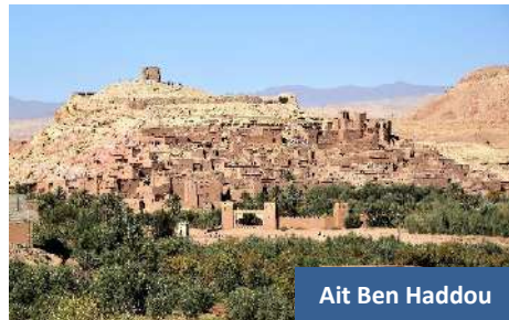
Ait Ben Haddou