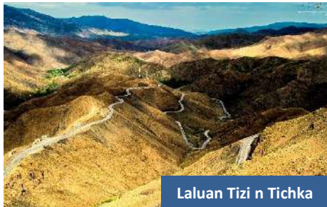
Laluan Tizi n Tichka

Perjalanan diteruskan ke Boumalne Du Dades yang merupakan wilayah Moroko yang terkenal dengan pemandangan yang indah. Daftar masuk dan bermalam di Dades Valley .