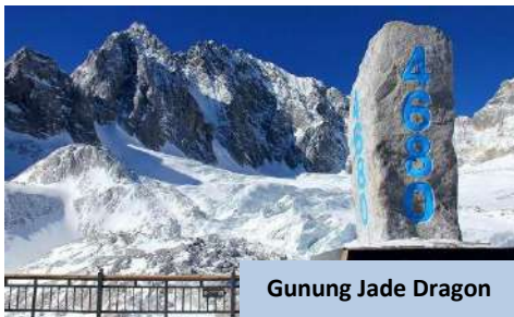
Gunung Jade Dragon

Makan tengah hari disediakan bungkus (Pack Lunch) dan makan malam akan dinikmati di restoran tempatan sebelum kembali ke hotel. Bermalam di Lijiang .