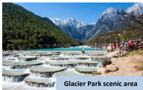
Glacier Park scenic area