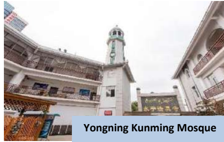
Yongning Kunming Mosque