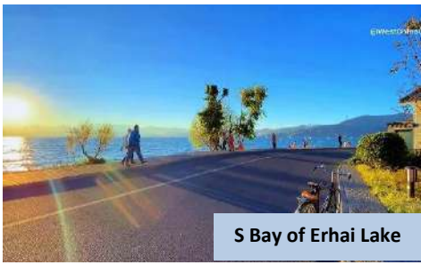
S Bay of Erhai Lake