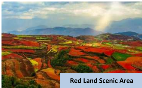
Red Land Scenic Area

Makan malam akan disediakan sebelum anda daftar masuk ke hotel untuk bermalam di Kunming .