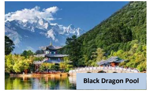
Black Dragon Pool