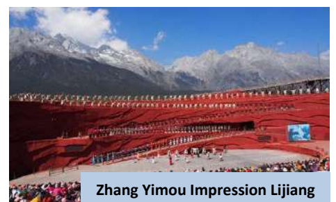
Zhang Yimou Impression Lijiang