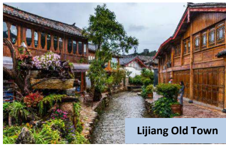
Lijiang Old Town