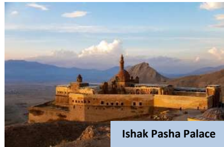
Ishak Pasha Palace