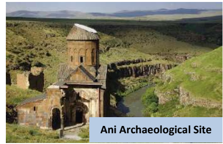
Ani Archaeological Site