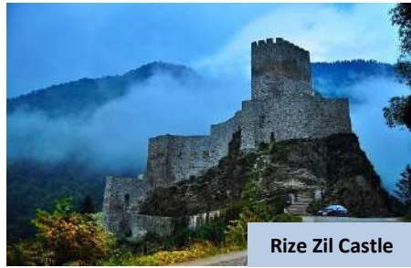
Rize Zil Castle