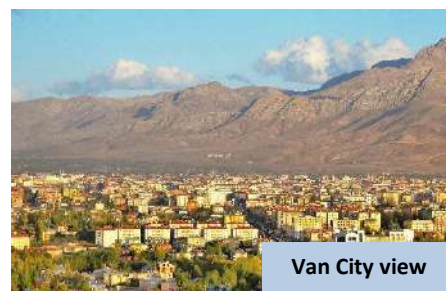
Van City view