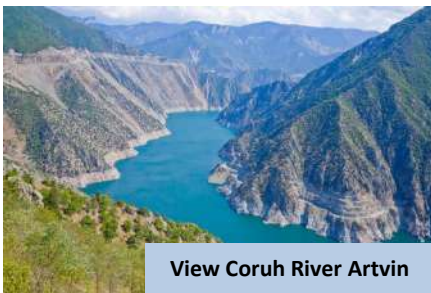
View Coruh River Artvin

Bertolak ke Savsat Karagol Nature Park , taman negara umpama syurga dunia bagi pencinta alam semulajadi. Dengan keindahan Tasik Karagol yang dikelilingi hutan dan pergunungan, ia menawarkan aktiviti perkelahan, rentas denai dan lokasi bergambar. Di sebelah petang pula, bertolak ke Şavsat pekan comel terletak di tengah tengah kawasan pergunungan yang indah untuk bermalam.