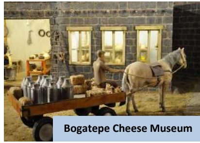
Bogatepe Cheese Museum