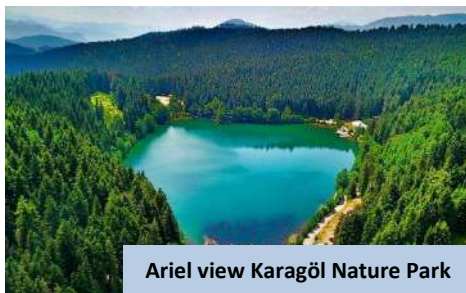
Ariel view Karagöl Nature Park