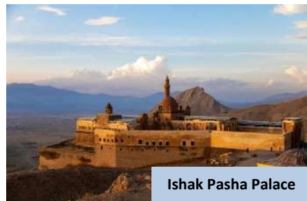
Ishak Pasha Palace