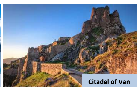
Citadel of Van