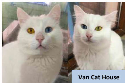
Van Cat House

Berlepas ke Istanbul untuk penerbangan seterusnya ke tanah air.