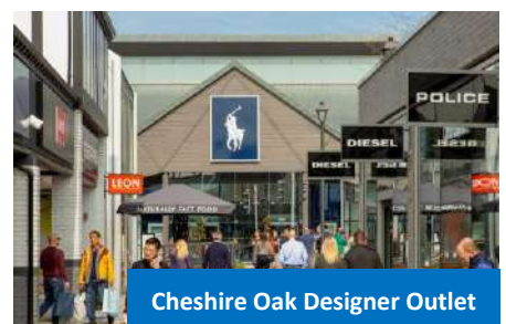
Cheshire Oak Designer Outlet