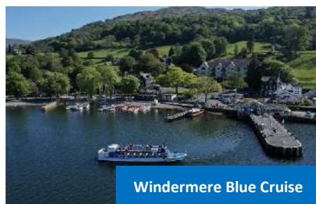
Windermere Blue Cruise