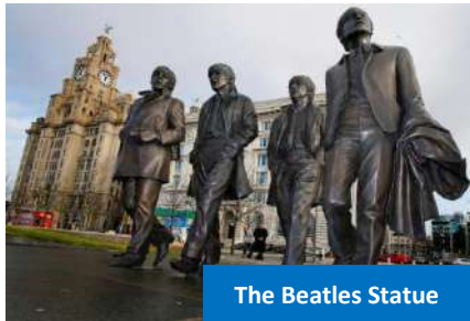
The Beatles Statue

Kemudian, bertolak ke Lapangan Terbang Manchester untuk penerbangan pulang.