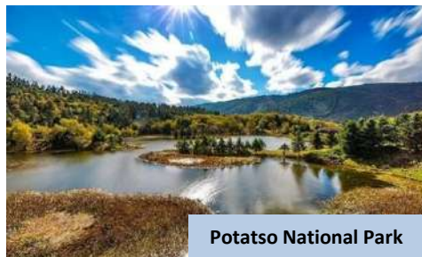
Potatso National Park

Setibanya di Kunming , daftar masuk ke hotel dan bermalam.