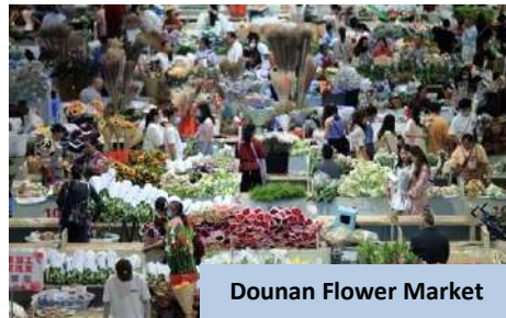
Dounan Flower Market