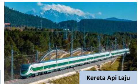
Kereta Api Laju