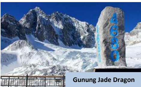
Gunung Jade Dragon

Makan tengah hari disediakan bungkus (Pack Lunch) dan makan malam akan dinikmati di restoran tempatan sebelum kembali ke hotel. Bermalam di Lijiang .