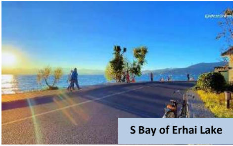
S Bay of Erhai Lake