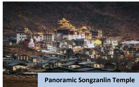
Panoramic Songzanlin Temple