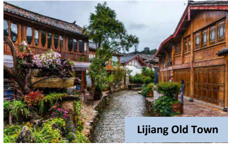
Lijiang Old Town