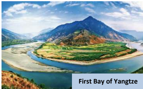
First Bay of Yangtze

Setelah selesai lawatan, anda akan daftar masuk ke hotel untuk berehat. Bermalam di Shangri-La , sebuah bandar yang terletak di barat laut Yunnan, adalah kawasan yang indah dengan budaya Tibet yang kaya dan suasana pergunungan Himalaya. Dikelilingi pemandangan gunung, padang rumput, dan udara sejuk sepanjang tahun, ia terkenal sebagai " syurga tersembunyi ". Nama Shangri-La diambil daripada novel James Hilton yang menggambarkan tempat ini sebagai syurga.