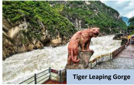
Tiger Leaping Gorge