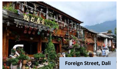
Foreign Street, Dali