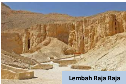
Lembah Raja Raja

Nikmati makan malam sebelum dihantar ke lapangan terbang domestik untuk penerbangan ke Kaherah ETD 8.00 malam. Setiba di Kaherah ETA 9.10 malam dan daftar masuk hotel di Kaherah .