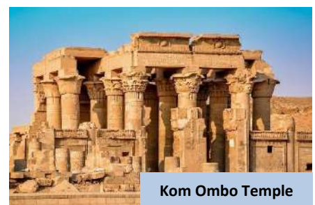
Kom Ombo Temple