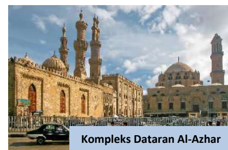
Kompleks Dataran Al-Azhar