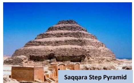
Saqqara Step Pyramid