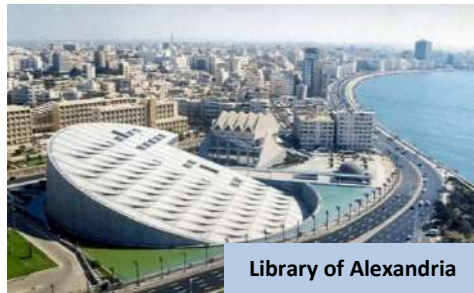
Library of Alexandria