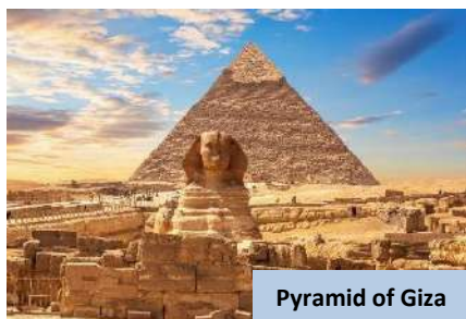
Pyramid of Giza

Seterusnya, masa santai membeli-belah minyak wangi dan produk berasaskan Papyrus di pusat pengeluaran tempatan. Pada lewat petang, anda akan dibawa untuk refresh break sebelum bergerak ke stesen keretapi Kaherah untuk berlepas ke Aswan pada jam ETD 7.45 malam. Makan malam disediakan di dalam keretapi.