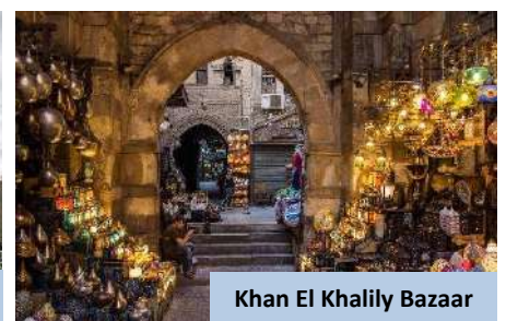
Khan El Khalily Bazaar