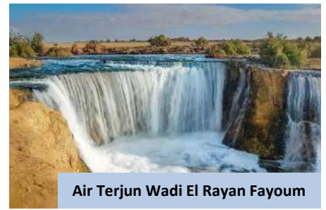
Air Terjun Wadi El Rayan Fayoum