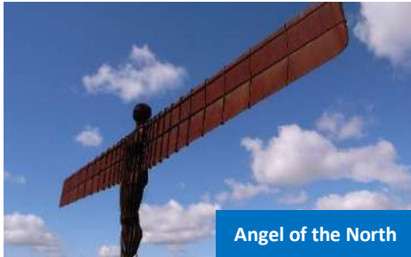
Angel of the North

Akhir hari, berhenti seketika untuk bergambar di kawasan viewpoint Forth Bridges , yang menampilkan jambatan-jambatan ikonik yang merentasi Firth of Forth . Daftar masuk hotel dan bermalam di Edinburgh .