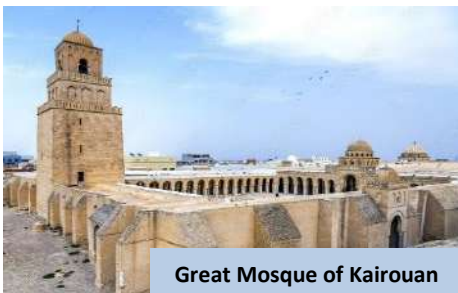
Great Mosque of Kairouan

Setibanya di sana, daftar masuk hotel dan berehat. Makan malam buffet disediakan di hotel dan bermalam di Tozeur .