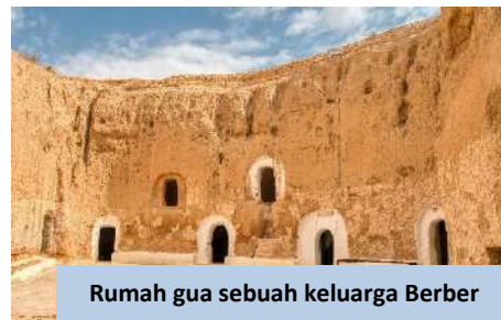
Rumah gua sebuah keluarga Berber