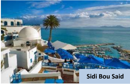
Sidi Bou Said