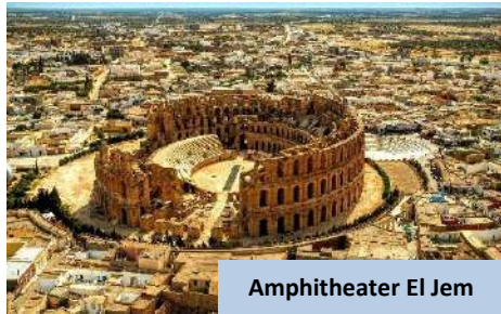
Amphitheater El Jem

Kemudian, meneruskan perjalanan ke Hammamet , destinasi peranginan pantai yang terkenal dengan suasana santai dan pemandangan Laut Mediterranean yang indah. Setibanya di sana, daftar masuk hotel dan nikmati makan malam buffet.