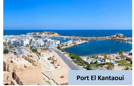
Port El Kantaoui