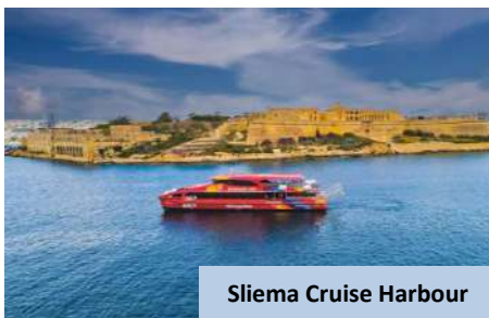
Sliema Cruise Harbour